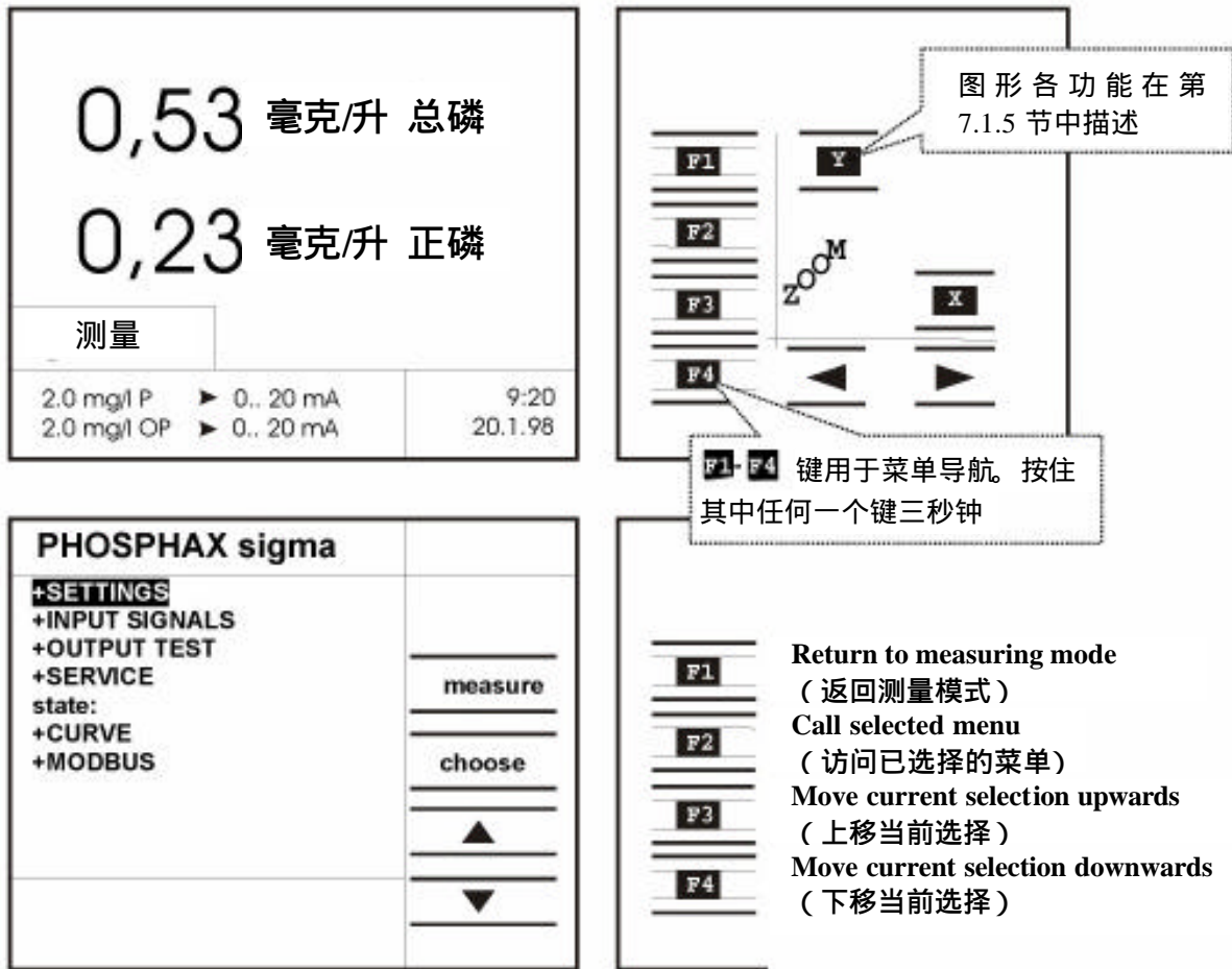
图 19 菜单系统